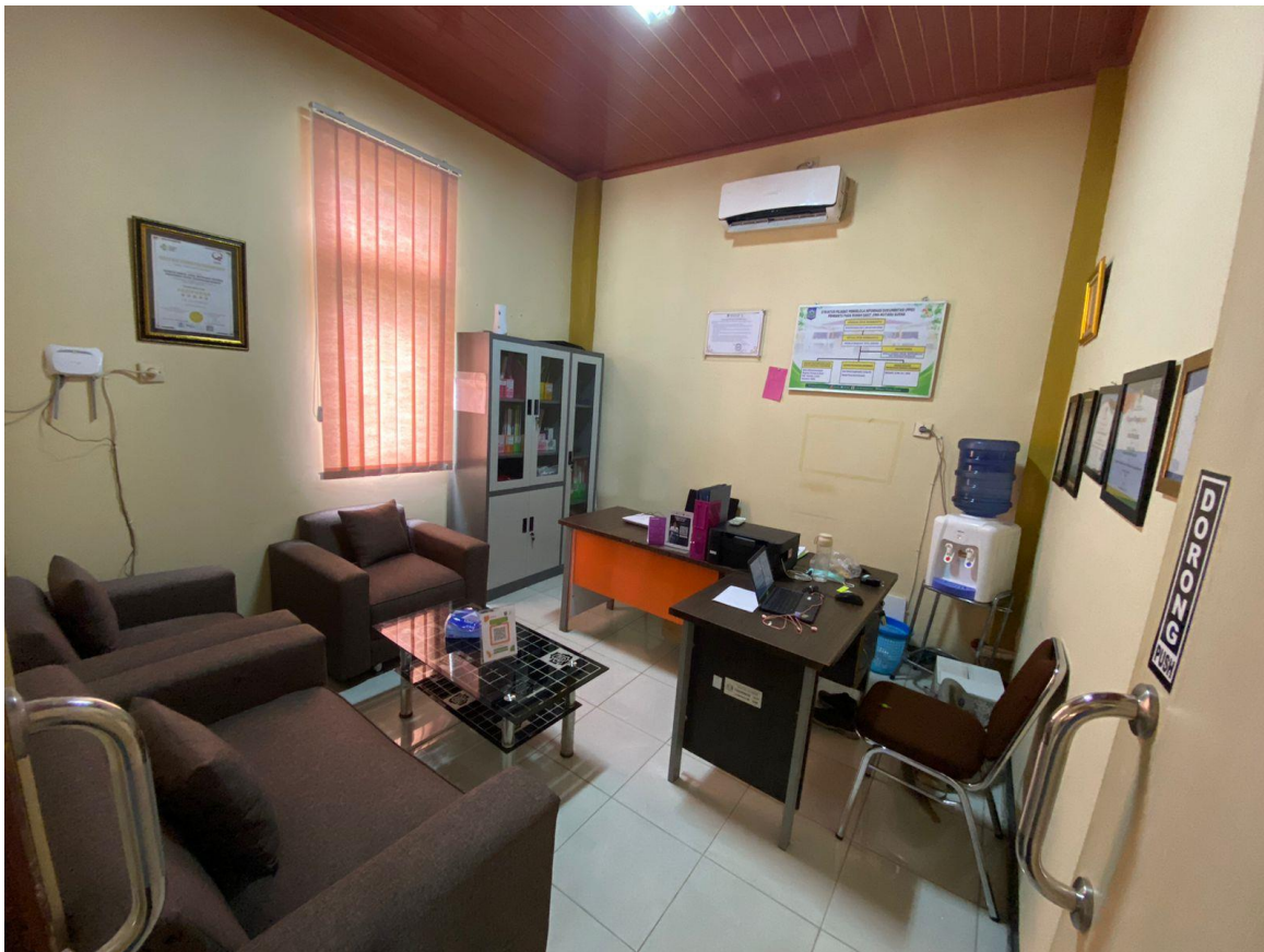
Foto Sarana dan Prasarana PPID Rumah Sakit Jiwa Mutiara Sukma di Sekretariat dan di Poliklinik